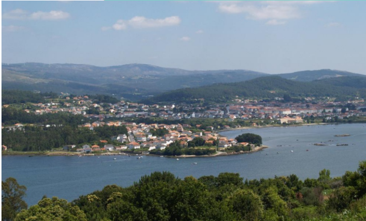
13-14-Punta e praia da Barquiña