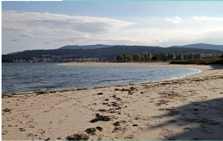
7- Praia do Testal, de 1850 m de lonxitude. Un dos mellores bancos marisqueiros da ría de Noia.