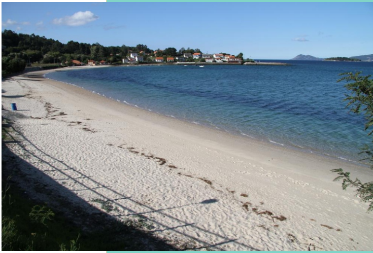
1-Praia Boa Grande