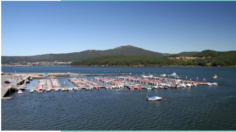
8-Punta do Testal e porto