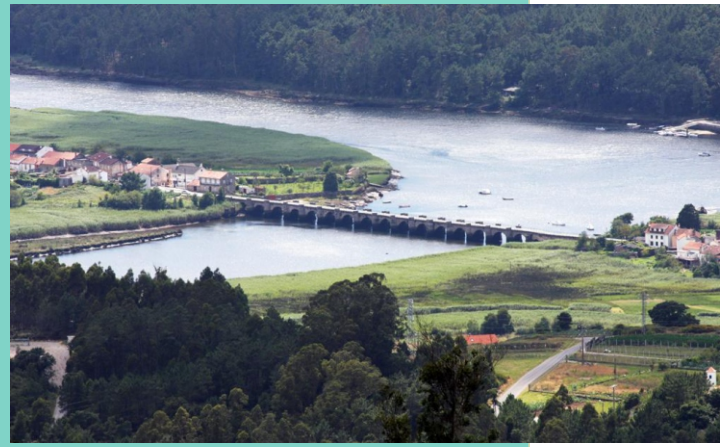
17-Esteiro do Tambre