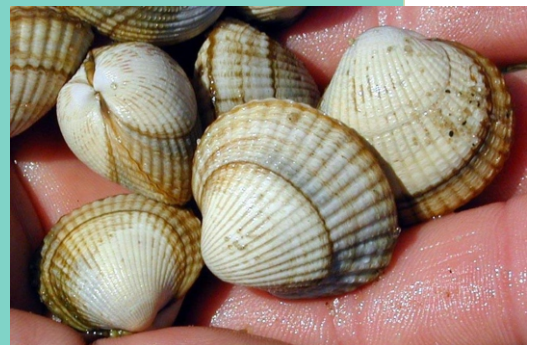
Berberechos ( Cerastoderma edule ). Os areas do fondo da ría de Noia son importantes bancos marisqueiros nos que destaca, sobre todo, a produción de berberechos.