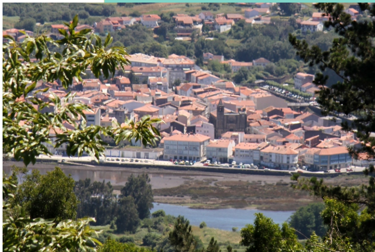
11-NOI. Unha antiga vila mariñeira que conserva un fermoso casco histórico, declarado Conxunto Histórico Artístico en 1981, e acolle importantes restos arqueolóxicos e boas representacións da arte románica e gótica.