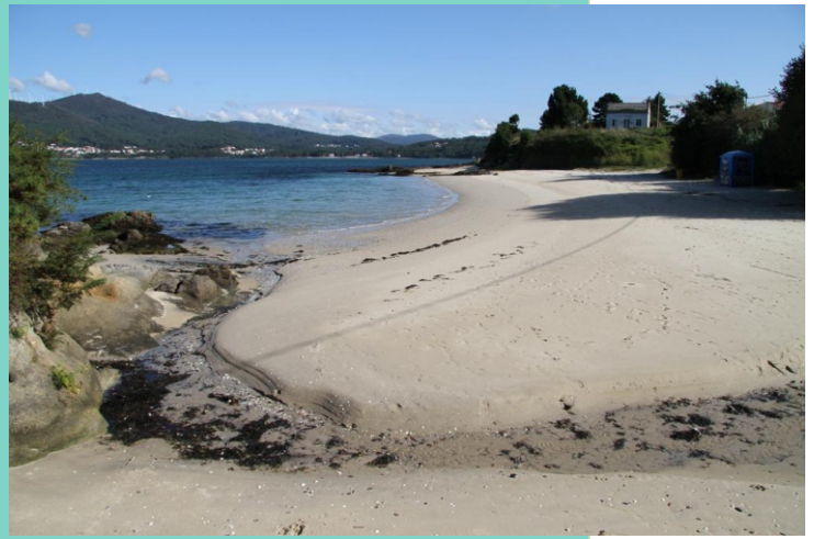
3-Praia Boa Pequena