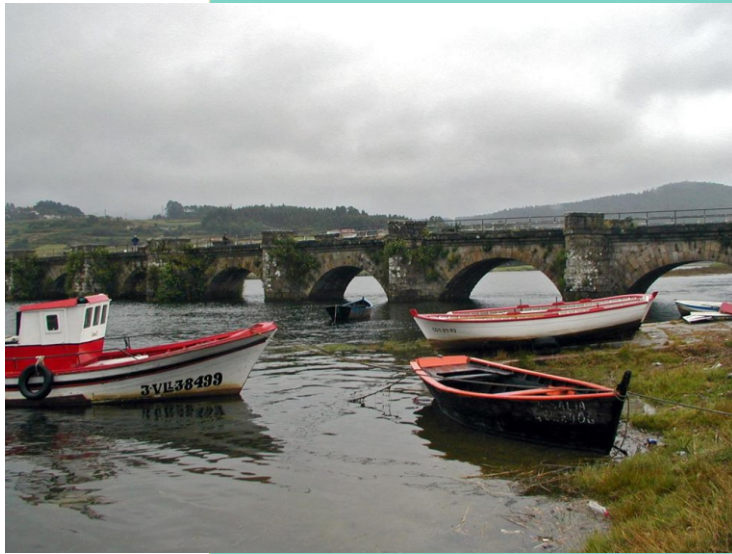
18-Ponte Nafonso. Construída na Idade media substituindo a comunicación das dúas beiras por barca. Foi sometida a diversas reformas ata o século XX.