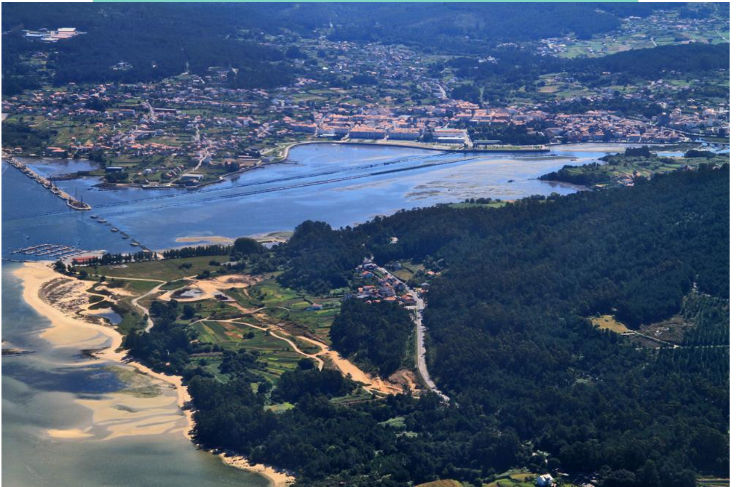
Vista aérea desde a Punta Mexilloiro ata o fondo da ría de Noia. Na outra banda da ponte en construción As Abruñeiras.