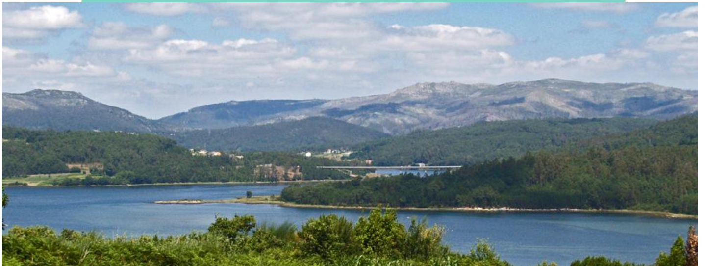
16-A Saíña. Punta Peón